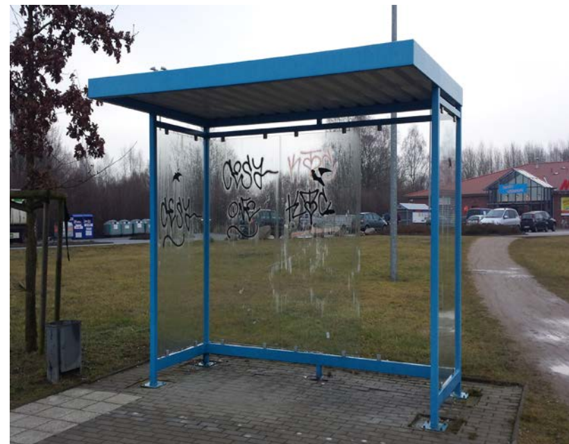
Sitzgruppe aus dem Buswartehaus

Vor einigen Wochen wurde die Sitzgruppe Buswartehaus an der Haltestelle Sporthuus im Beidendorfer Weg entwendet. Gleichzeitig kam es dort zur Zerstörung der gläsernen Rückwand. Sachdienliche Hinweise zur Wiederbeschaffung der blauen Sitzgruppe bitten wir an die Gemeinde zu richten. Tel.: 04508 631